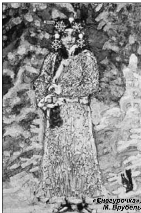
«Снегурочка», М. Врубель