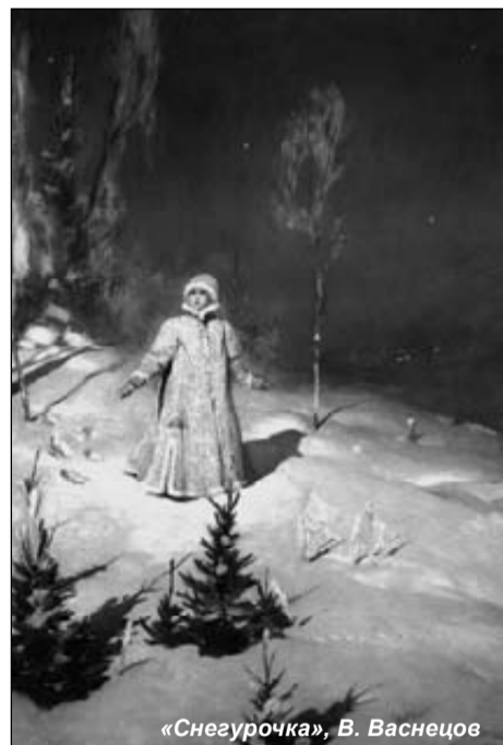
«Снегурочка», В. Васнецов

в том, что девушку, которая олицетворяла Кострому, проносили по деревне на носилках, затем несли в лес и оставляли под деревом. Вместо девушки в качестве Костромы использовали также чучело, сделанное из ржаного снопа, в женской одежде, которое топили в реке или сжигали в лесу. Обряд призван был обеспечить плодородие земли.