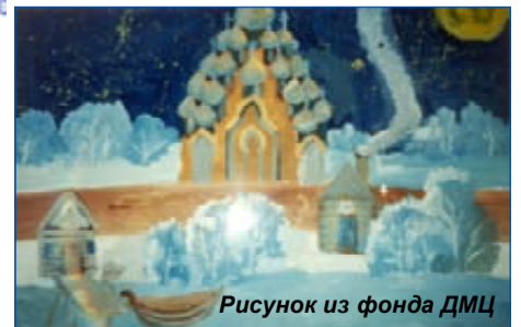
Рисунок из фонда ДМЦ

Положение о конкурсе размещено на сайте музея-заповедника «Кижы» http://kizhi.karelia.ru в разделе «Информация «Конкурсы».