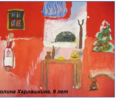
Полина Харлашкина, 9 лет

Скалка тоненько-тоненько раскатала сканцы для калиток. Такие тоненькие, что на свет светятся. Красивы калитки. В духовке быстро зарумянились. Аромат по избе распространился. Насто вскопчила, взяла пельешко да каждую калитку маслом смазала. В это время дедушка соседский на огонек зашел. Сказал по-карельски: